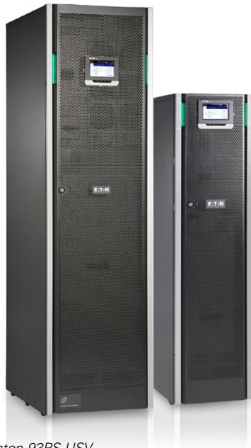
Eaton 93PS USV