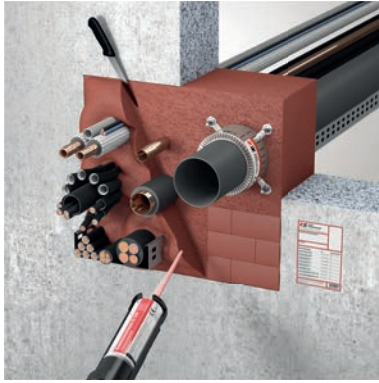
Brandschutzschaum ZZ 330 MW